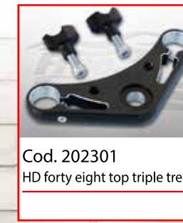
Cod. 202301 HD forty eight top triple trees