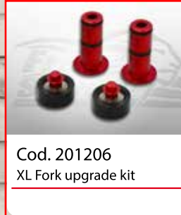
Cod. 201206 XL Fork upgrade kit