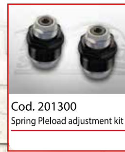
Cod. 201300 Spring Pleload adjustment kit