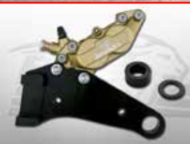
Cod. 205707 Rear bracket brake calliper 4 pot (Rotor diam.11"1/2)