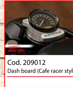
Cod. 209012 Dash board (Cafe racer style)