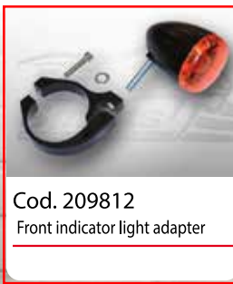
Cod. 209812 Front indicator light adapter