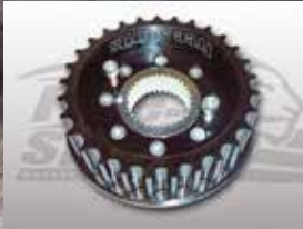
Cod. 207602 27 teeth pulley Cod. 207601 28 teeth pulley Cod. 207600 29 teeth pulley