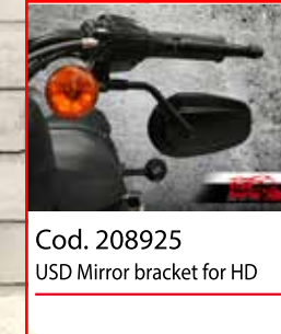
Cod. 208925 USD Mirror bracket for HD