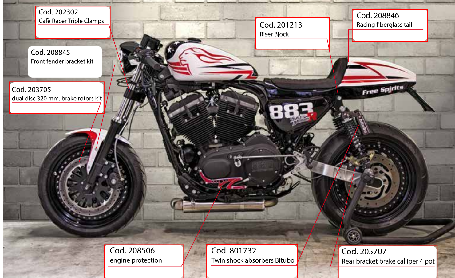
Cod. 205707 Rear bracket brake calliper 4 pot