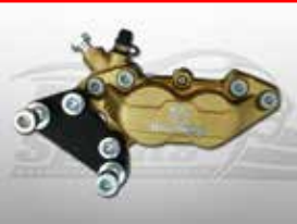
Cod. 203905 Front bracket brake calliper 4 pot