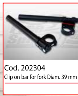
Cod. 202304 Clip on bar for fork Diam. 39 mm