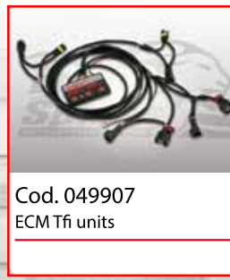
Cod. 049907 ECM Tfi units