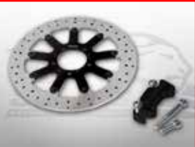
Cod. 203704 320 mm. brake rotors kit