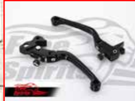
Cod. 173910 Brake & clutch levers reclining and adjustable