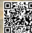
Cod. 306105 Foot-rest