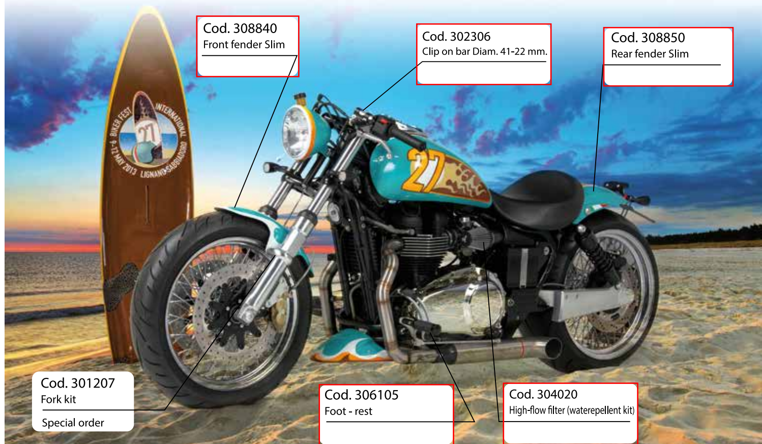
Cod. 308840 Front fender Slim