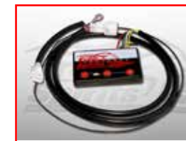
Cod. 049931 ECM Tfi units