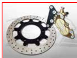
Cod. 303814 Front brake calliper 4 pot

As Free Spirits tradition, all the modification are reversible.