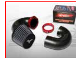
Cod. 304020 High-flow filter (Water Repellent) kit