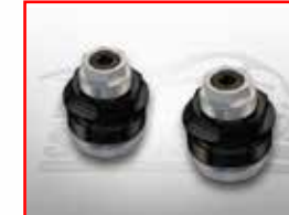
Cod. 301300 Spring preload adjustment kit