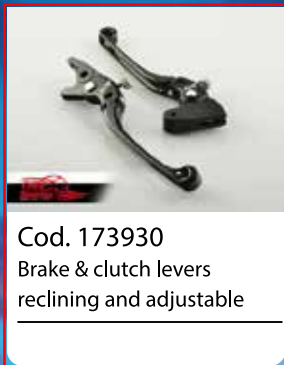
Cod. 173930 Brake & clutch levers reclining and adjustable