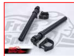
Cod. 302305 Clip on bar Diam. 41-25.4mm.