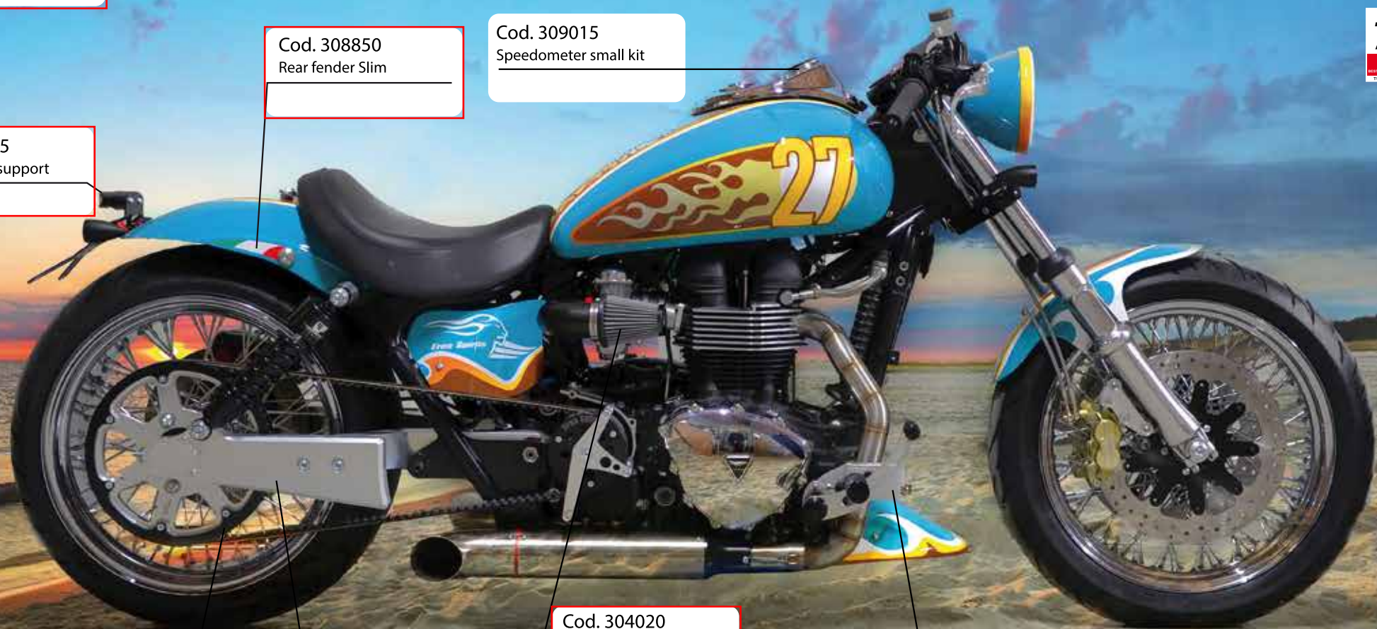
Cod. 307586 Belt drive conversion kit