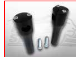
Cod. 302606 Handlebr riser (6 inch rise)