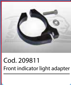
Cod. 209811 Front indicator light adapter