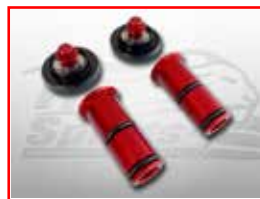
Cod. 301200 Fork upgrade kit