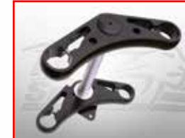
Cod. 302614 Triple Clamps (+3 degree rake)