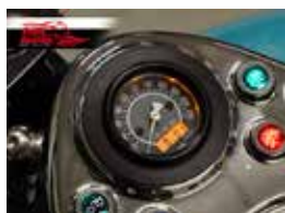
Cod. 309015 Tachometer kit