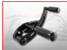
Cod. 306105 Foot - rest